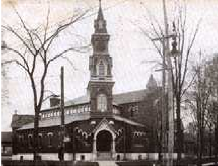
Le « Dime Tabernacle » de Battle Creek, 1879