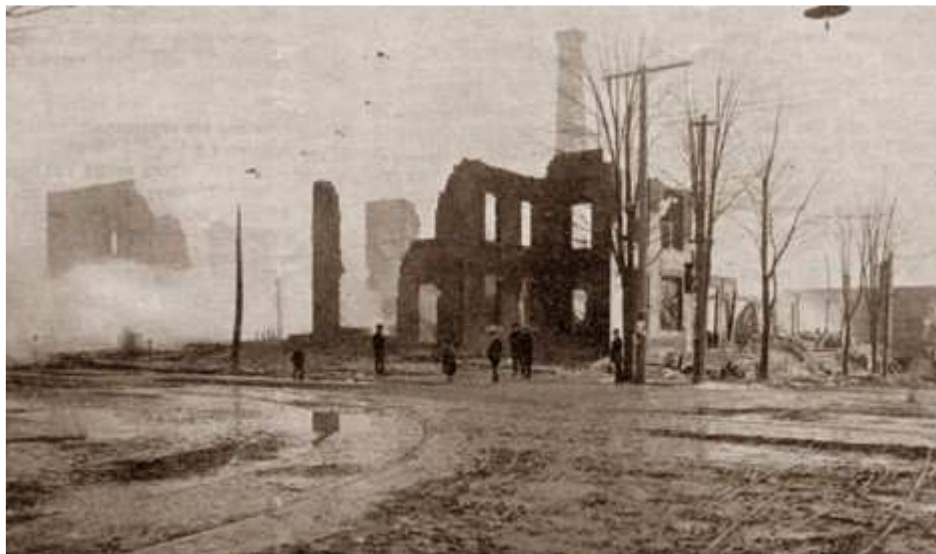
Le même bâtiment après l'incendie du 30 décembre 1902.