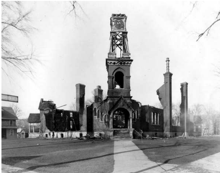
Le « Dime Tabernacle » de Battle Creek après l'incendie de 1922.