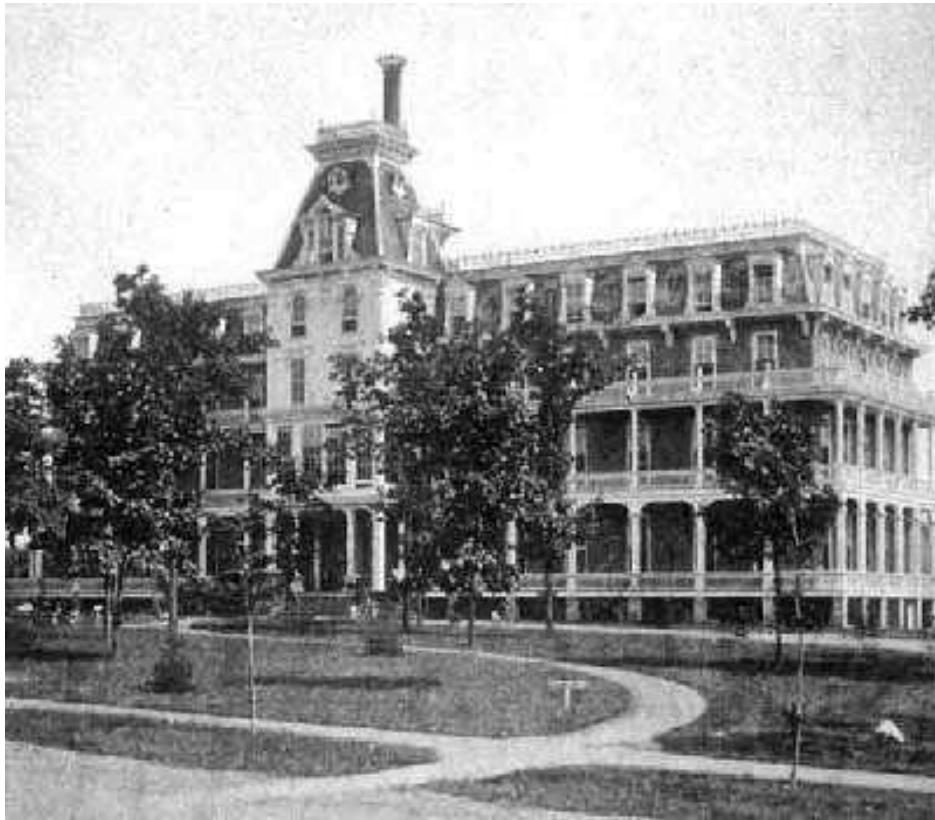
Bâtiment du Sanatorium de Battle Creek construit en 1877 sous la direction de James White.