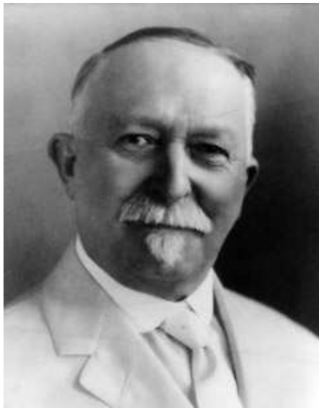
Dr John Harvey Kellogg