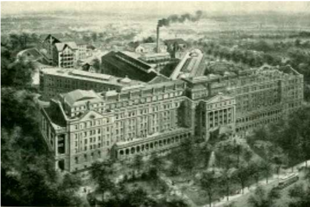
Le sanatorium reconstruit, après l'incendie, selon les plans du Docteur Kellogg.

La prochaine cible serait la jeunesse adventiste.