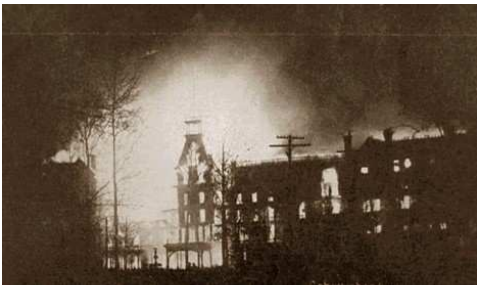
Le même bâtiment lors de l'incendie du 18 février 1902.